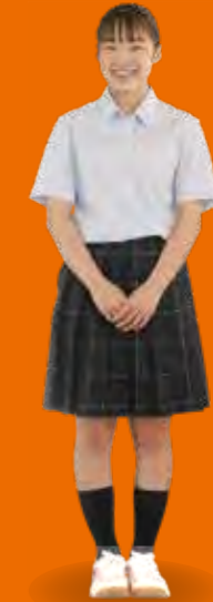
女子 SUMMER コーデ C