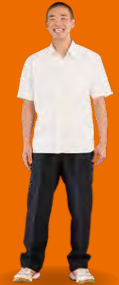
男子 SUMMER コーデ B