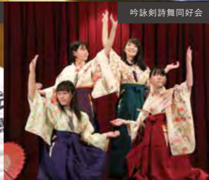
吟詠剣詩舞同好会