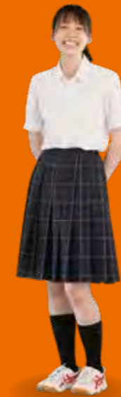
女子 SUMMER コーデ B