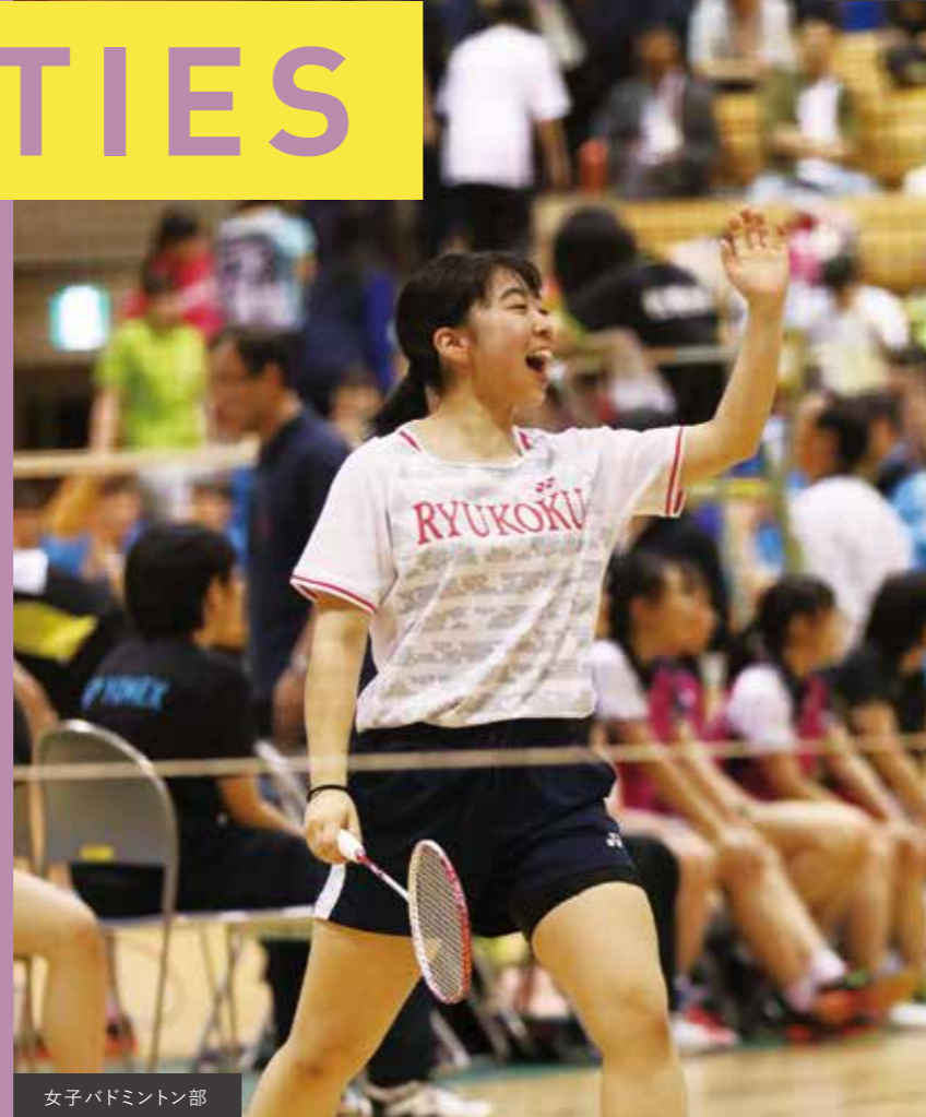
女子バドミントン部