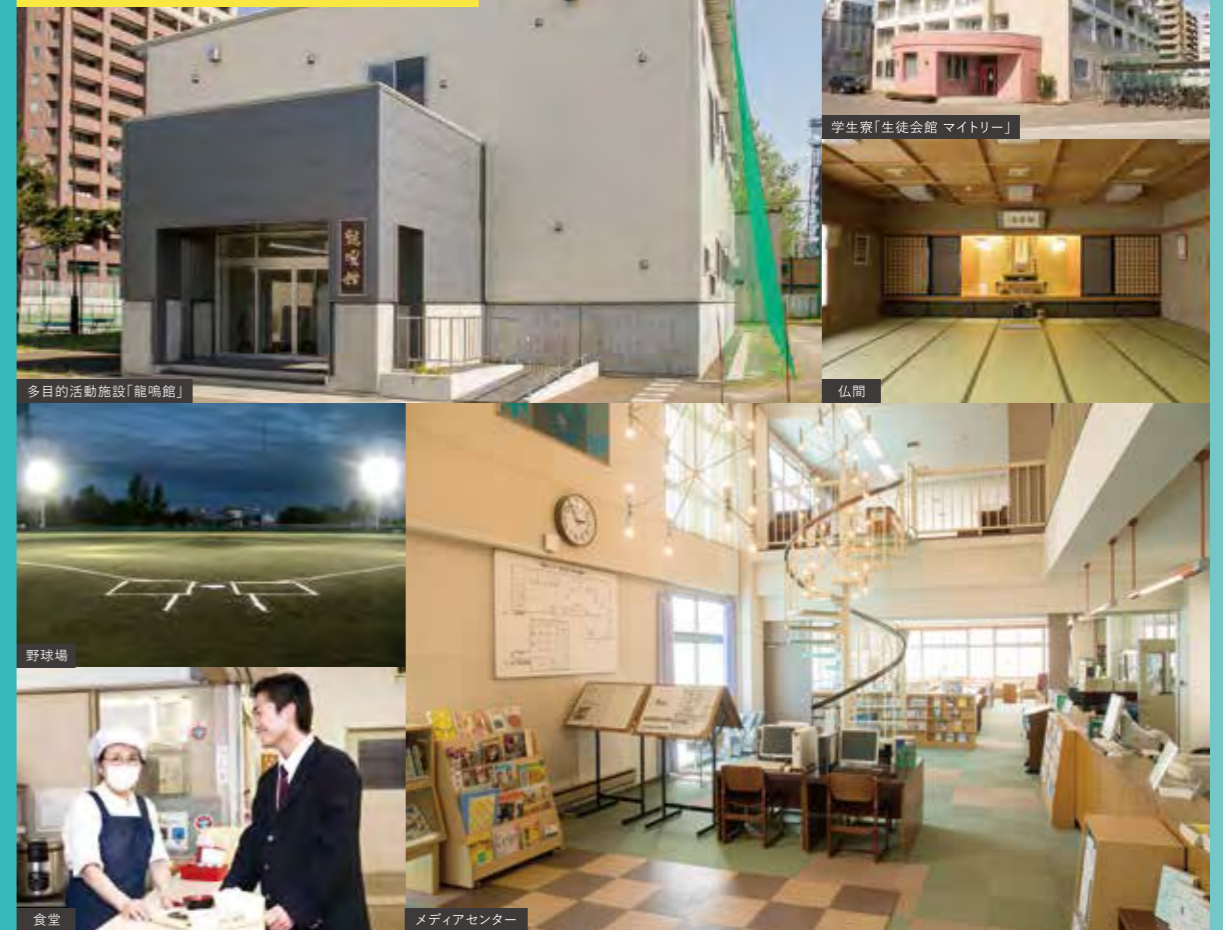
多目的活動施設「能鳴館」