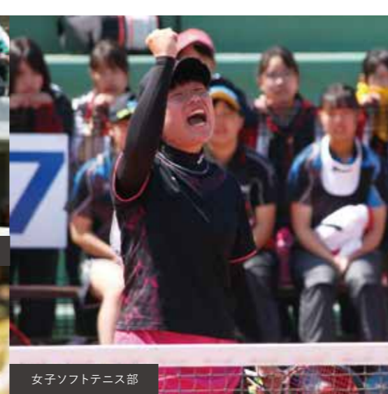
女子ソフトテニス部