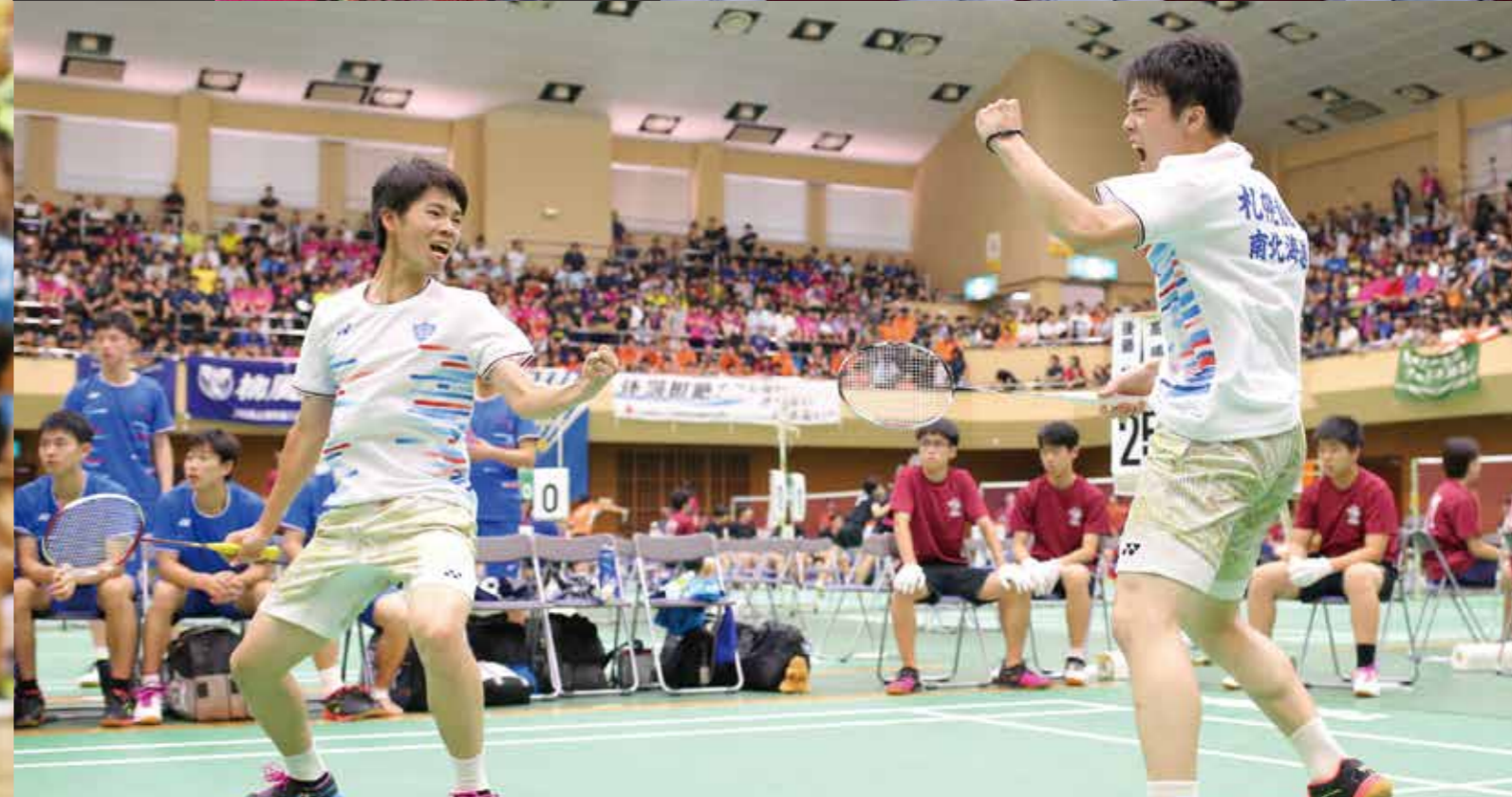
男子バドミントン部